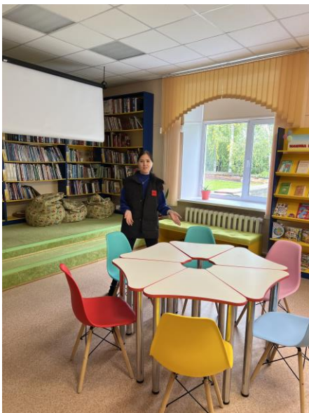
Проект «Мамина библиотека»