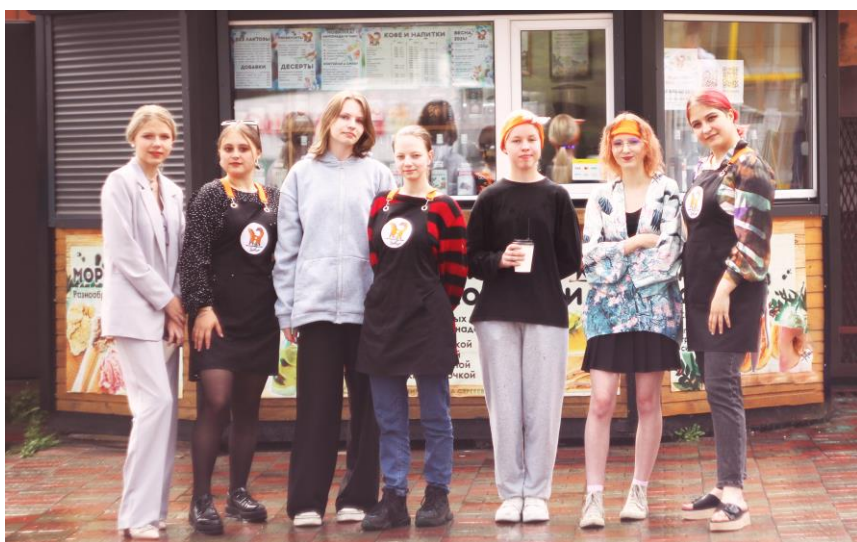
Помощники бариста – первый день!

Проект «А первую тысячу я заработал «На заводе», Тулунская городская ОО поддержки молодежных социальных проектов и творческих инициатив «ТУЛУН.РУ».