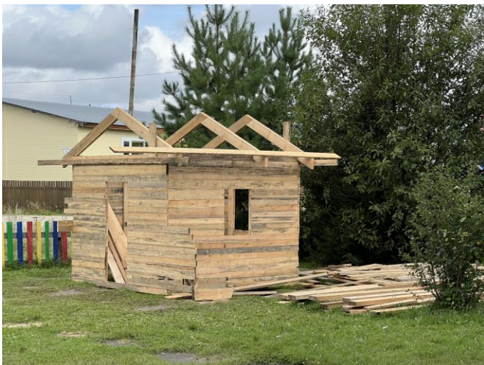
Проект «Любимая площадка»