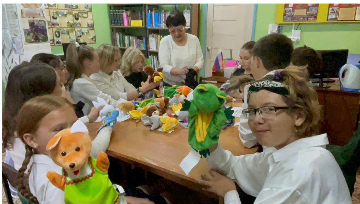
На фото: теперь в селе Талда работает кукольный театр!

Все инициативы реализованы в полном объеме на хорошем уровне к началу осени.