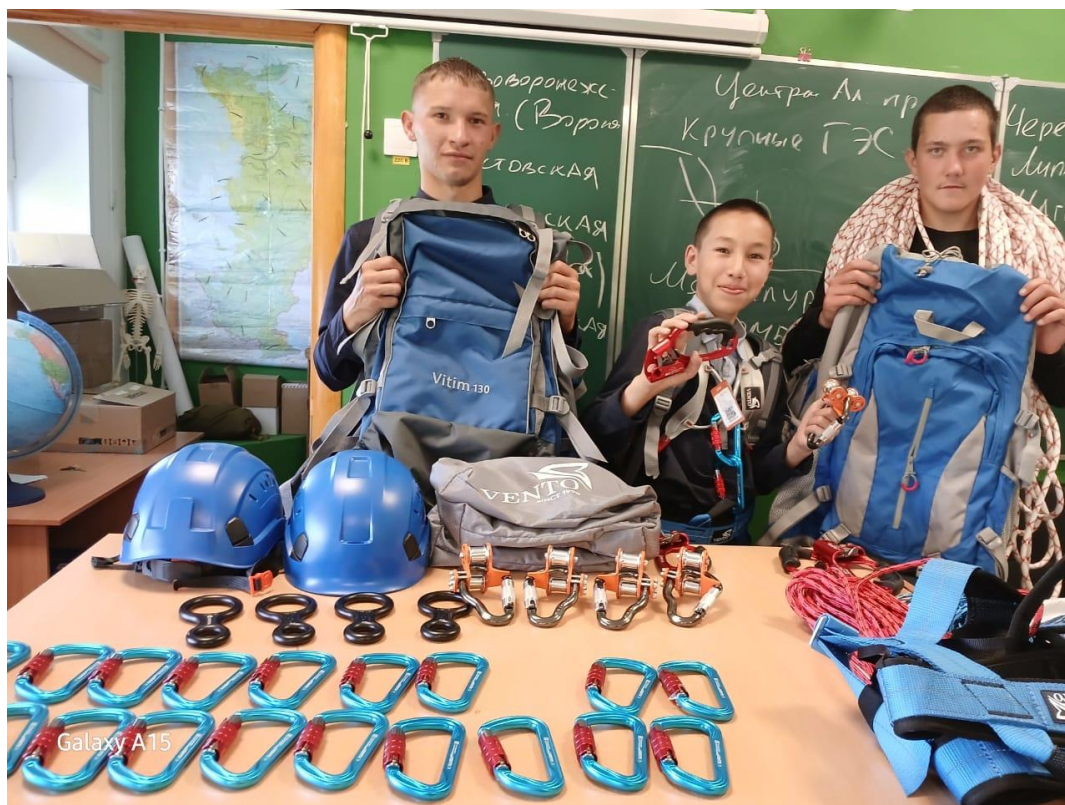
На фото: туристы к походу готовы!