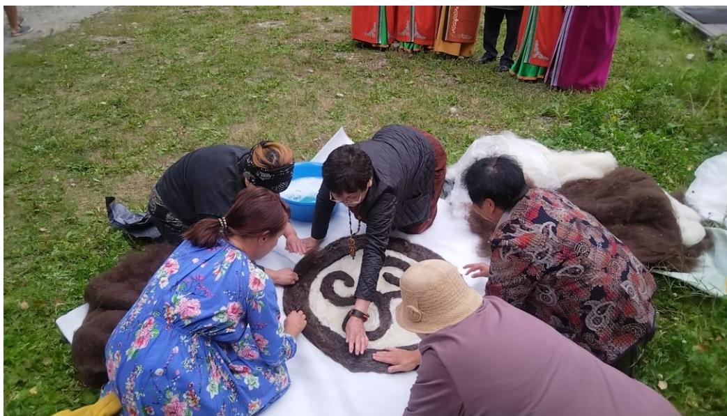
На фото: фестиваль Ширдекфест