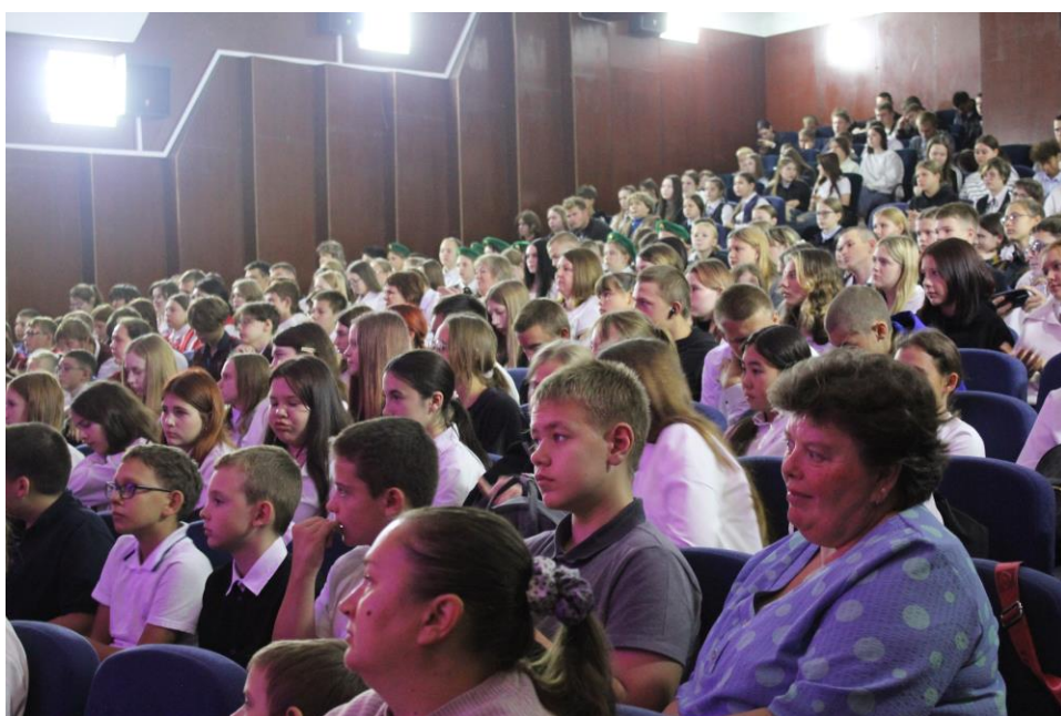
На фото: участники заключительного мероприятия проекта в п. Краснозерское

Проект «Карьерный гид. Траектория», местная культурно-просветительская общественная организация Краснозерского района «Навигатор успеха».