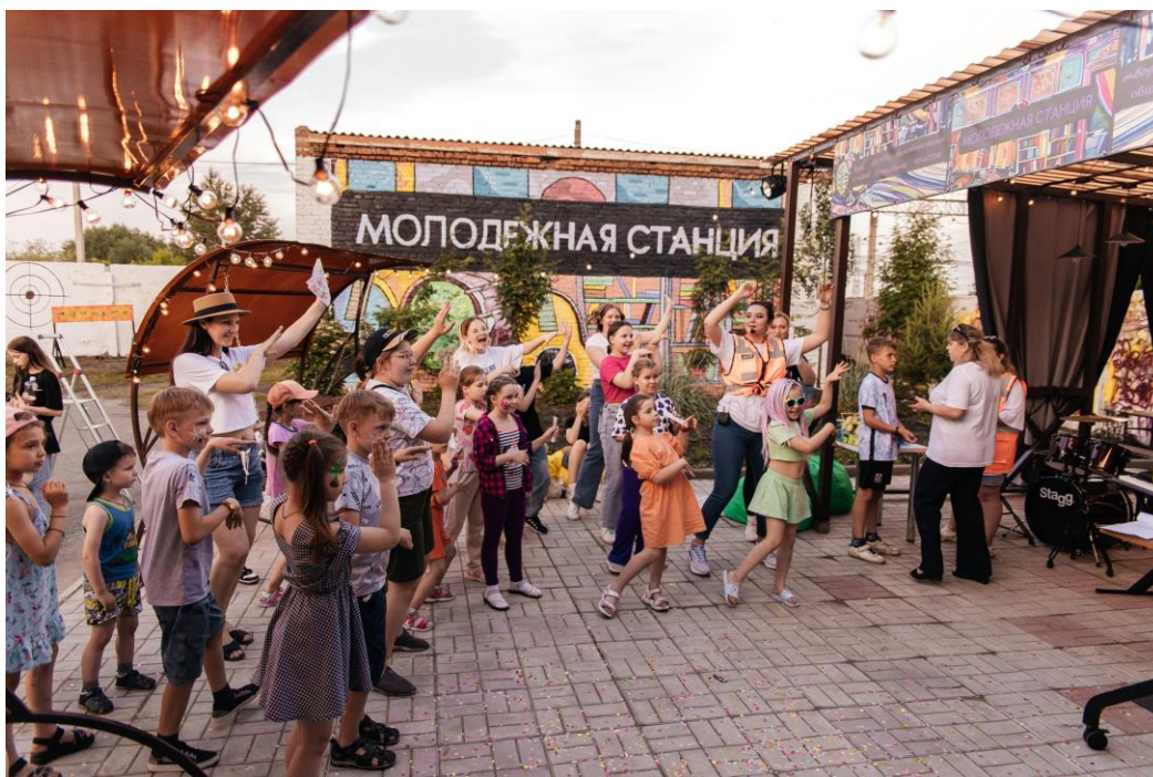
На фото: мероприятие на созданной в Исилькуле площадке

Проект «Молодежная станция» расширяет границы», местная ОО Исилькульского района Омской области по сохранению и развитию библиотечного дела «БИБЛИОСФЕРА».