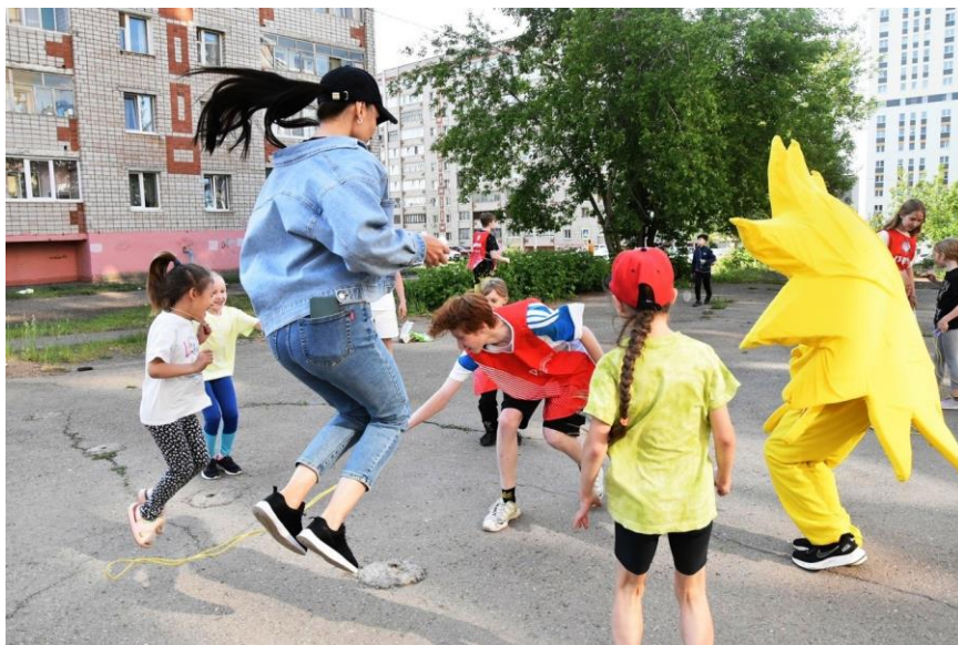
Проект #СпортЯсемья (г. Ижевск, Удмуртская республика) предполагал организацию здорового досуга для семей с детьми.

1. В 2023 году завершился цикл работ по второму конкурсу «Спорт для всех», который был объявлен в 2022 году. Тогда были поддержаны 65 проектов из разных регионов России. По этому конкурсу в 2023 году проводились мониторинги (20 мониторинговых визитов в первой половине года), 6 вебинаров, практические мастерские в формате онлайн по подведению итогов реализации проектов – 1 онлайн-встреча в июне и 2 онлайн-встречи в сентябре 2023 г.