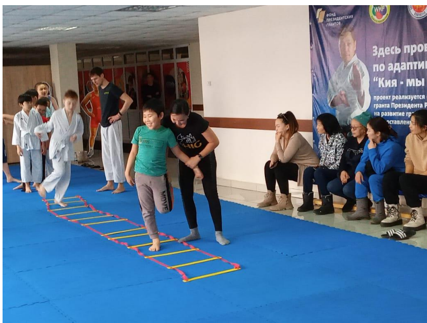
Проект «Спорт без границ» (г. Улан-Удэ, Республика Бурятия) был направлен на круглогодичную реабилитацию детей-инвалидов через занятия адаптивным каратэ.